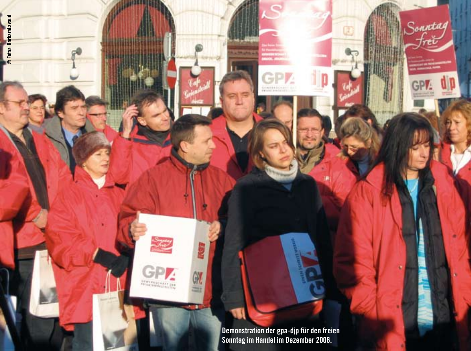
Demonstration der gpa-djp für den freien Sonntag im Handel im Dezember 2006.

schlag nicht zur Auszahlung kommt. Dabei betrifft das eine große Gruppe von ArbeitnehmerInnen. Von den mehr als 500.000 unselbstständig Beschäftigten im Handel sind 30 bis 40 Prozent teilszeitbeschäftigt und davon wiederum die Mehrzahl sind Frauen.