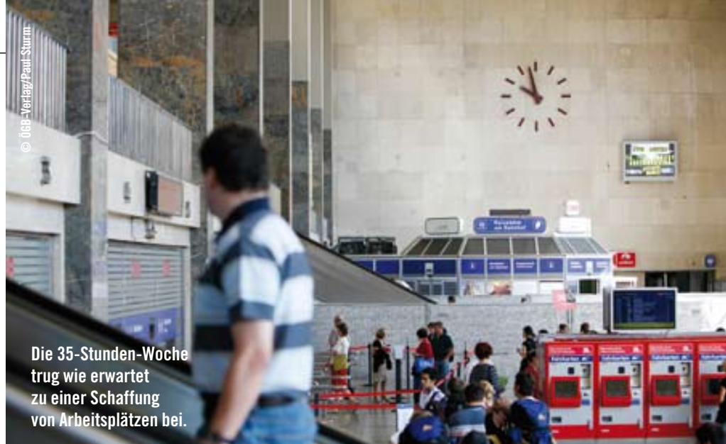
Die 35-Stunden-Woche trug wie erwartet zu einer Schaffung von Arbeitsplätzen bei.

Obwohl die 35-Stunden-Woche bei den ArbeitnehmerInnen einhellig als